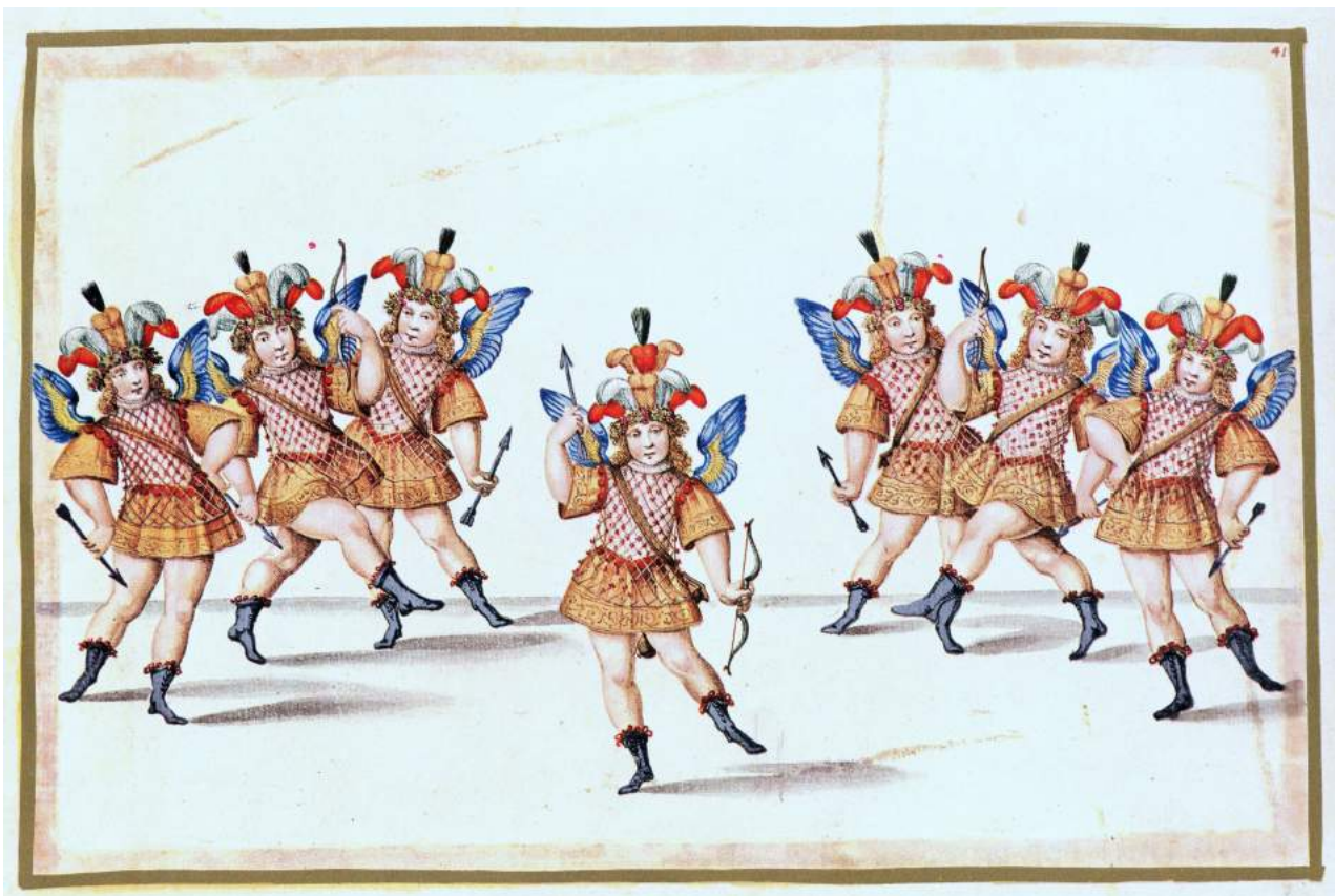
S.A.R. in abito d'Amore , Biblioteca Reale di Torino, Storia Patria 952, c. 41